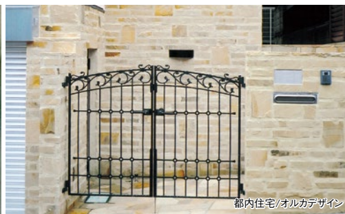
都内住宅/オルカデザイン