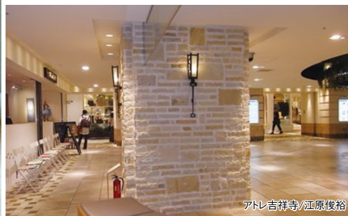
アトレ吉祥寺/江原俊裕