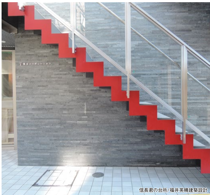
信長君の台所/福井英晴建築設計