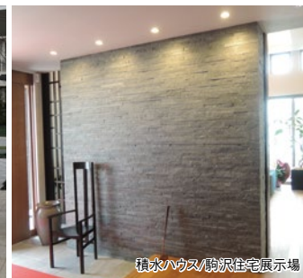
積水ハウス/駒沢住宅展示場